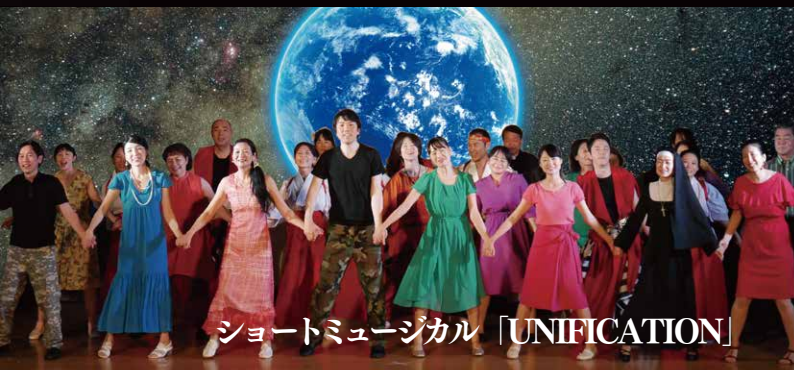
ショートミュージカル「UNIFICATION」