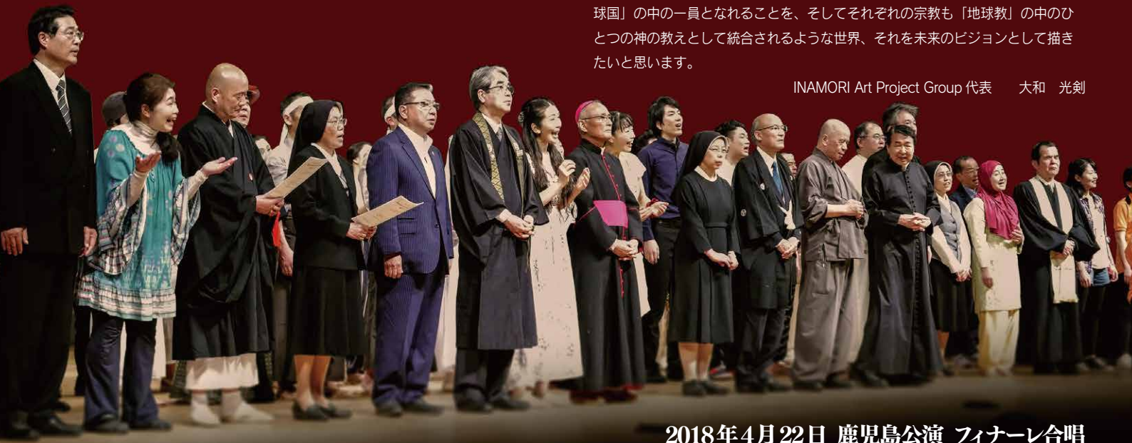
2018年4月22日 鹿児島公演 フィナーレ合唱